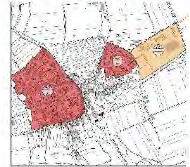
Bad Urach - Kernsiedlung