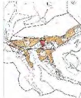
Bad Urach - Hengen