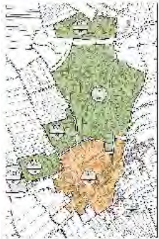
Bad Urach - Seeburg